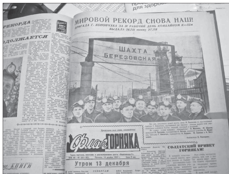
Страница шахтовой многотиражки «Флаг Горняка» за 14 декабря 1962 г. с репортажем о встрече горняков-рекордсменов

Для участия в рекорде подбирали людей, объяс-