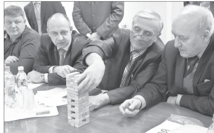
Тест на умение работать по правилам и оценивать риски в потенциально опасной ситуации выдержали не все участники

- Мне очень понравилось это социальное направление работы компании, привлече-