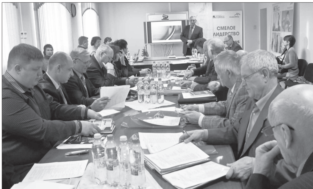
В заседании Совета приняли участие представители десяти компаний, большей частью угольных, а также специалисты из департамента труда и занятости населения Кемеровской области.